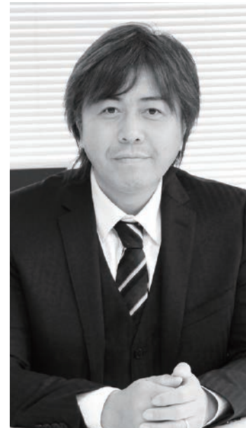
株式会社福德住建 代表取締役社長